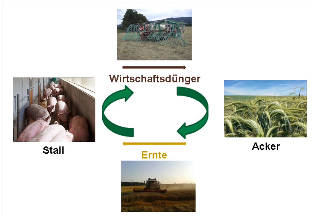
Abbildung 1: Wirtschaftsdünger ist aktiver Teil der Kreislaufwirtschaft